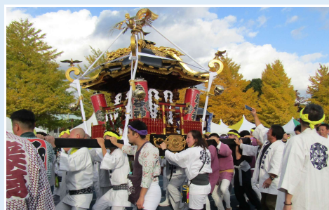
勇壮に練り歩く渋谷神社の神輿

11月16日（日）に海老名運動公園で開催された「えびな市民まつり」に渋谷神社神輿保存会・囃子保存会が参加し、神輿の練り歩き、囃子の演奏が盛大に行われました。