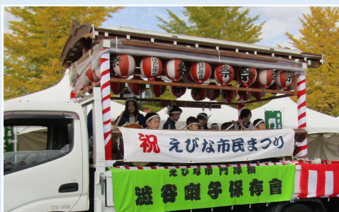
元気いっぱい囃子演奏