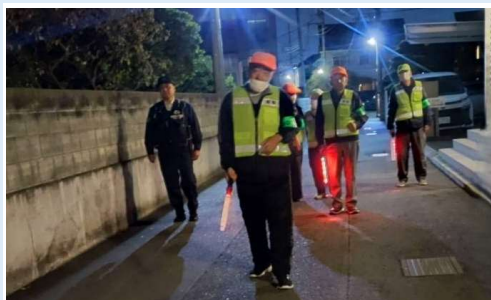
地域をくまなく巡回